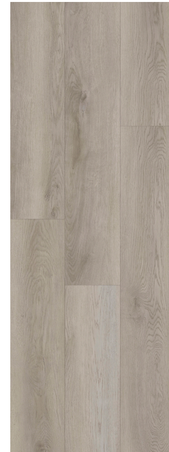
BEIGE SMOKED OAK