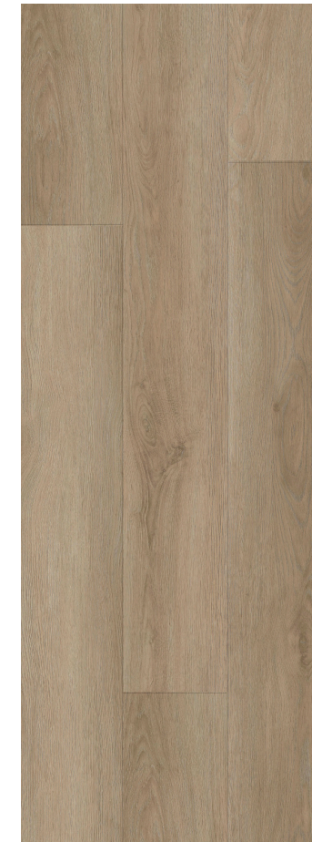
LIGHT CLASSIC OAK