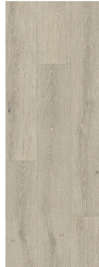
VANILLA LIMED OAK