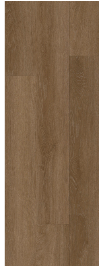
AMBER CLASSIC OAK