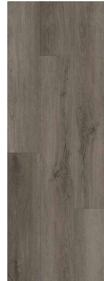
SEPIA CLASSIC OAK