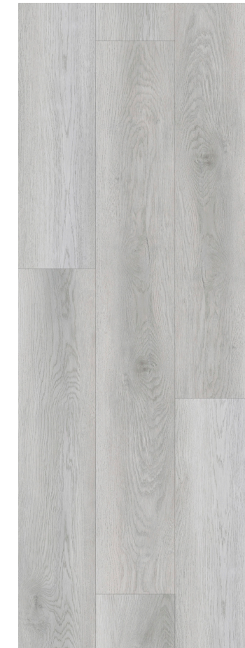
LIGHT GREY CLASSIC OAK