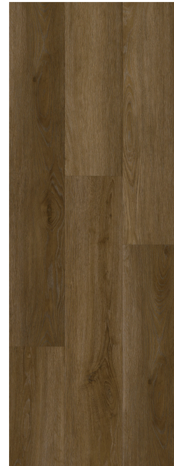
DARK CLASSIC OAK