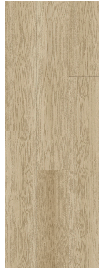
LIGHT NATURAL OAK