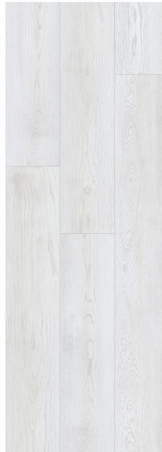
WHITE CLASSIC OAK