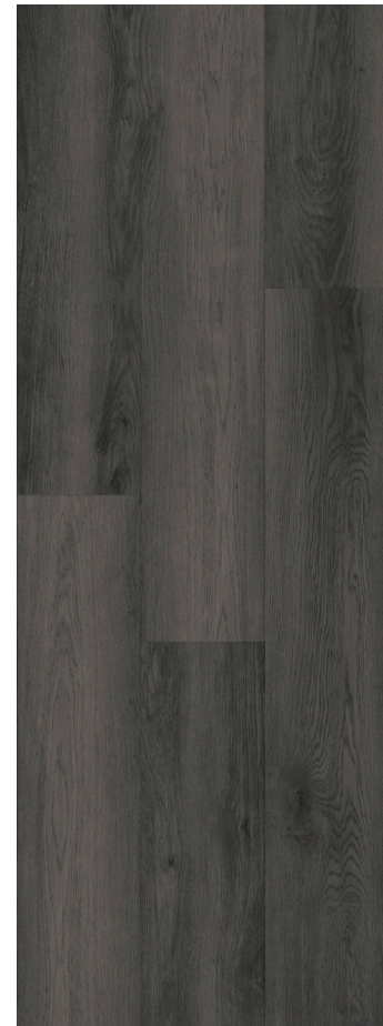
DARK GREY CLASSIC OAK