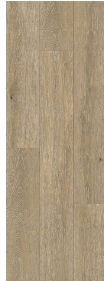
SAND LIMED OAK