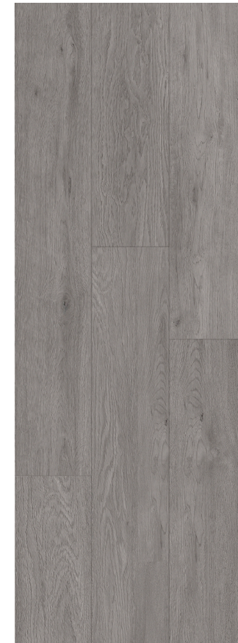
GREY CLASSIC OAK