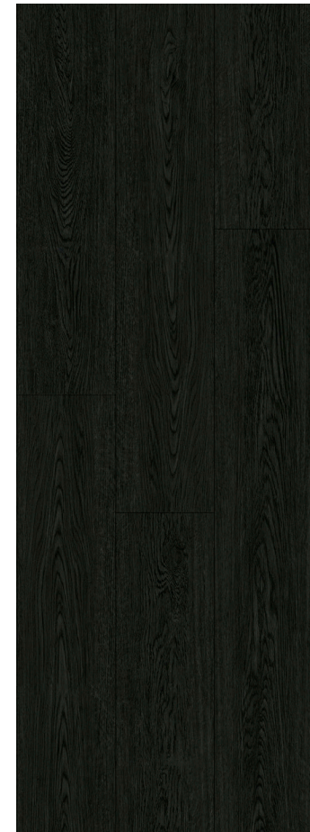
BLACK CLASSIC OAK